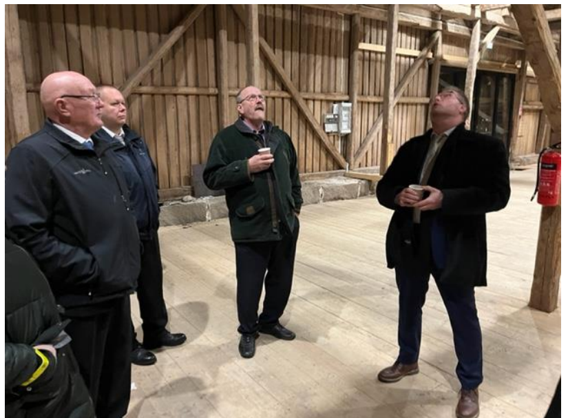
Deltagarna beundrar konstruktionerna i Tröskhuset.